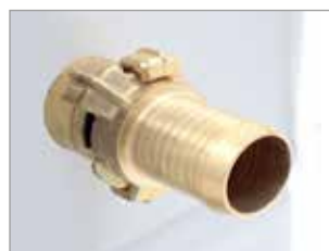
VALVE DE DÉBIT D'EAU