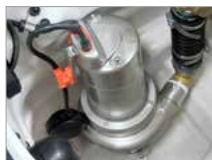
POMPE À IMMERSION HAUT RENDEMENT EN ACIER INOX POUR APPLICATION INDUSTRIELLE