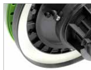
JOINT DE TÊTE NOVATEUR