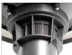
SYSTÈME ANTI-MOUSSE INTÉGRÉ