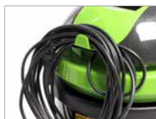
CROCHET POUR CÂBLE