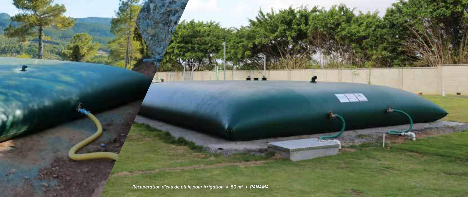
Récupération d'eau de pluie pour irrigation • 80 m 3 • PANAMA