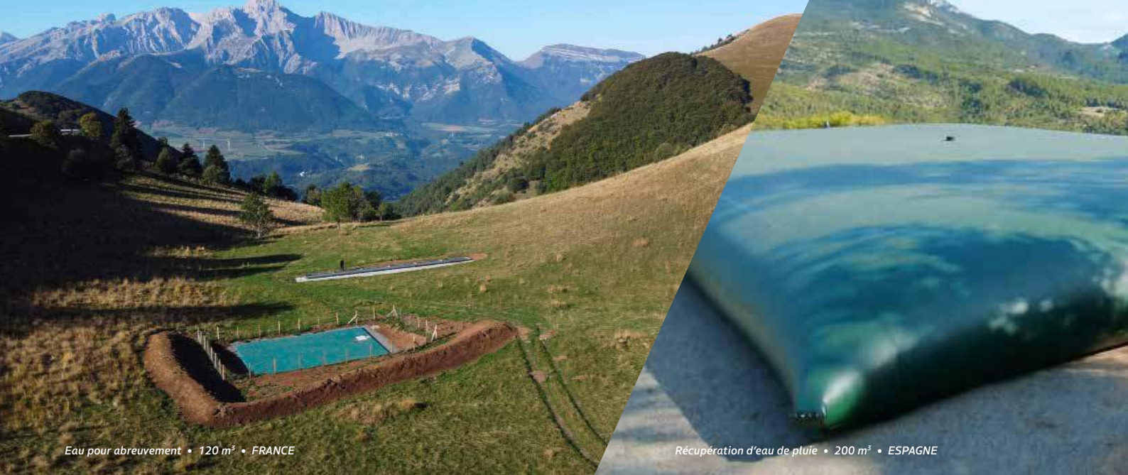
Eau pour abreuvement • 120 m 3 • FRANCE